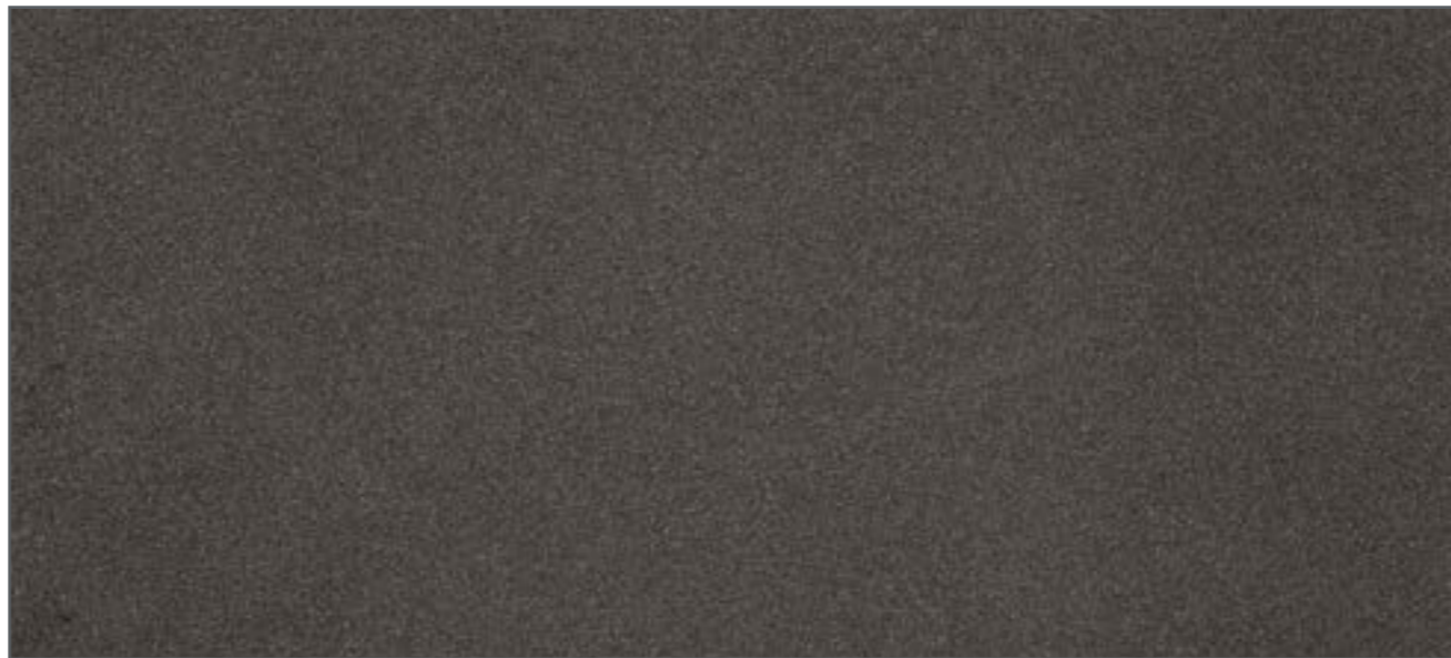
Ondergrond: Metaal/Aluminium Kleur: Aqua ML-69/sm-Multi-Lak 3in1 (DB 703 metaalgrijs)